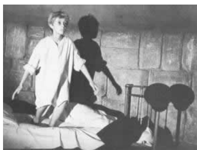
Figuur 0.2. Still uit IWANS JEUGD

In elk hoofdstuk staat één doorbraakfilm van een auteur centraal. De films zijn inwisselbaar, in elk hoofdstuk zou over een andere film grotendeels hetzelfde gezegd kunnen worden. In deze inleiding wordt de theorie verklaard aan de hand van de film IWANS JEUGD. 2